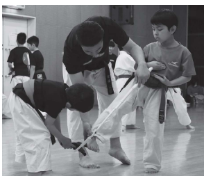
掃除用埃取りを指示棒に転用。ふだんは縮めて帯に差している。