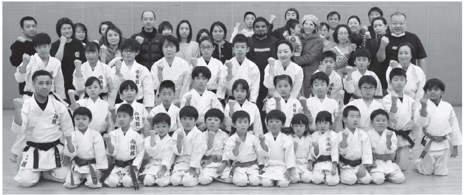
全日本空手道連盟剛柔会尚徳館のみなさん。湘南台道場にて。

チューブを握ってスナップを効かせると音が鳴る。「道具があると子どもたちが理解しやすいし、やる気になります」。