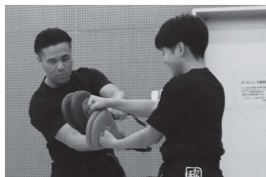
ミットを使った形の練習。合わせ突きを、しっかりミットに当てる。